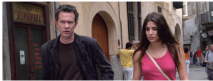
La caja Kovak (2006)