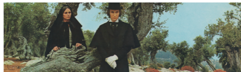
Jutrenka. Un invierno en Mallorca. (1969)

Ruta 2. Raixa, Cala Fornells, Formentor.