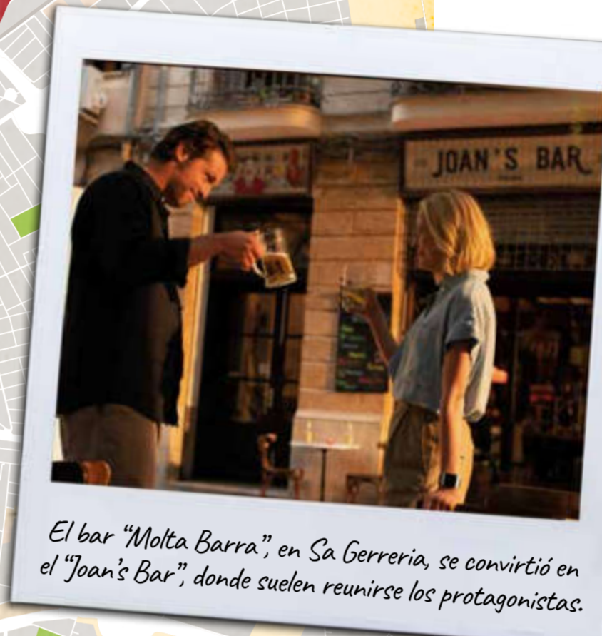
El bar "Joan's Bar", en Sa Gerreria, se convirtió en el "Joan's Bar", donde suelen reunirse los protagonistas.