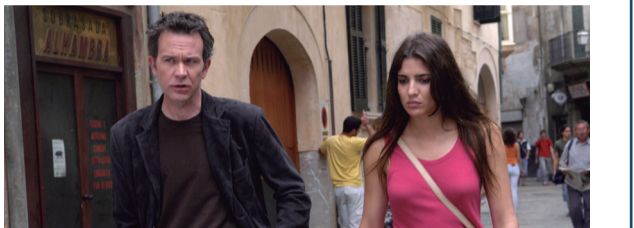
La caja Kovak (2006)