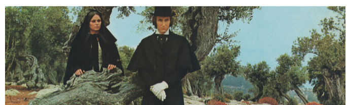
Jutzzenka. Un invierno en Mallorca (1969)

Ruta 2. Raixa, Cala Fornells, Formentor.